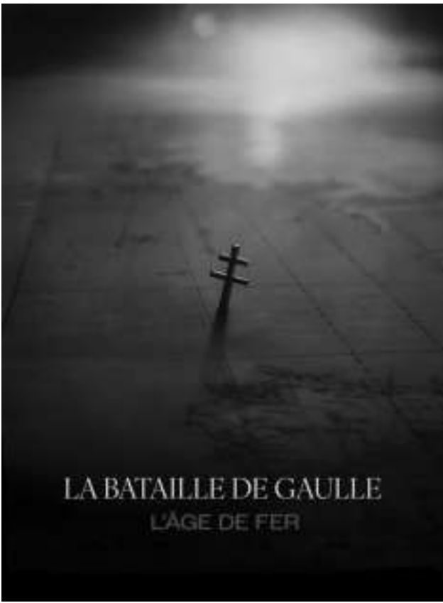
《戴高乐第1部分：自由法兰西》

去年，仅有一部本土影片——百代电影公司出品的喜剧系列电影《上帝保佑杜什一家》(God Save The Tuches)的第五部(300万观影人次)——跻身前十名，而前年则有三部。2025年法国电影的市场份额为37.7%，而2024年则为44.7%。